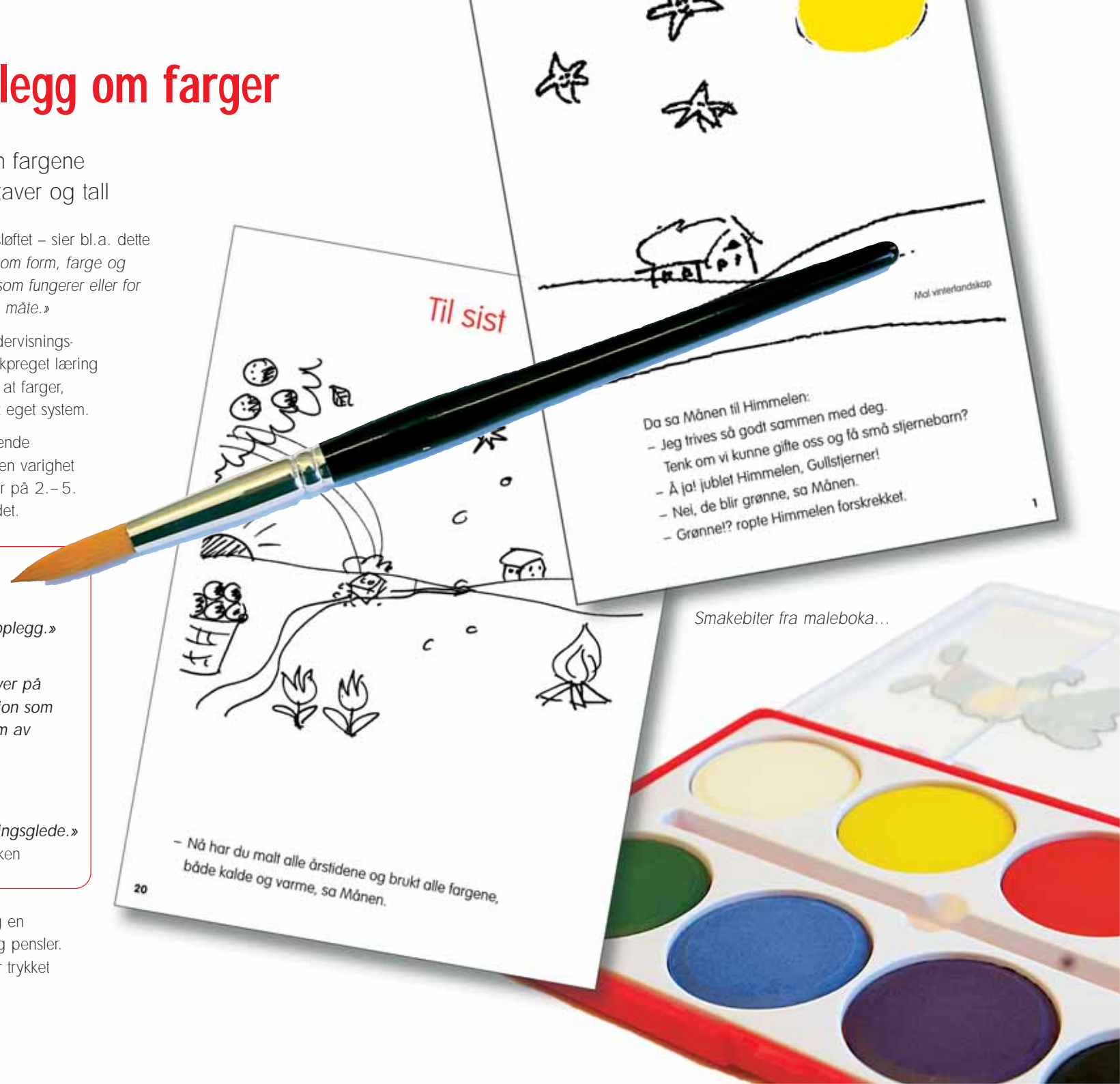
Smakebiter fra maleboka...

Undervisningsopplegget består av et elevhefte og en lærerveiledning. I tillegg trenger du vannfarger og pensler. Maleboka er bygd opp som en historie. Heftet er trykket på papir beregnet på vannfarger.